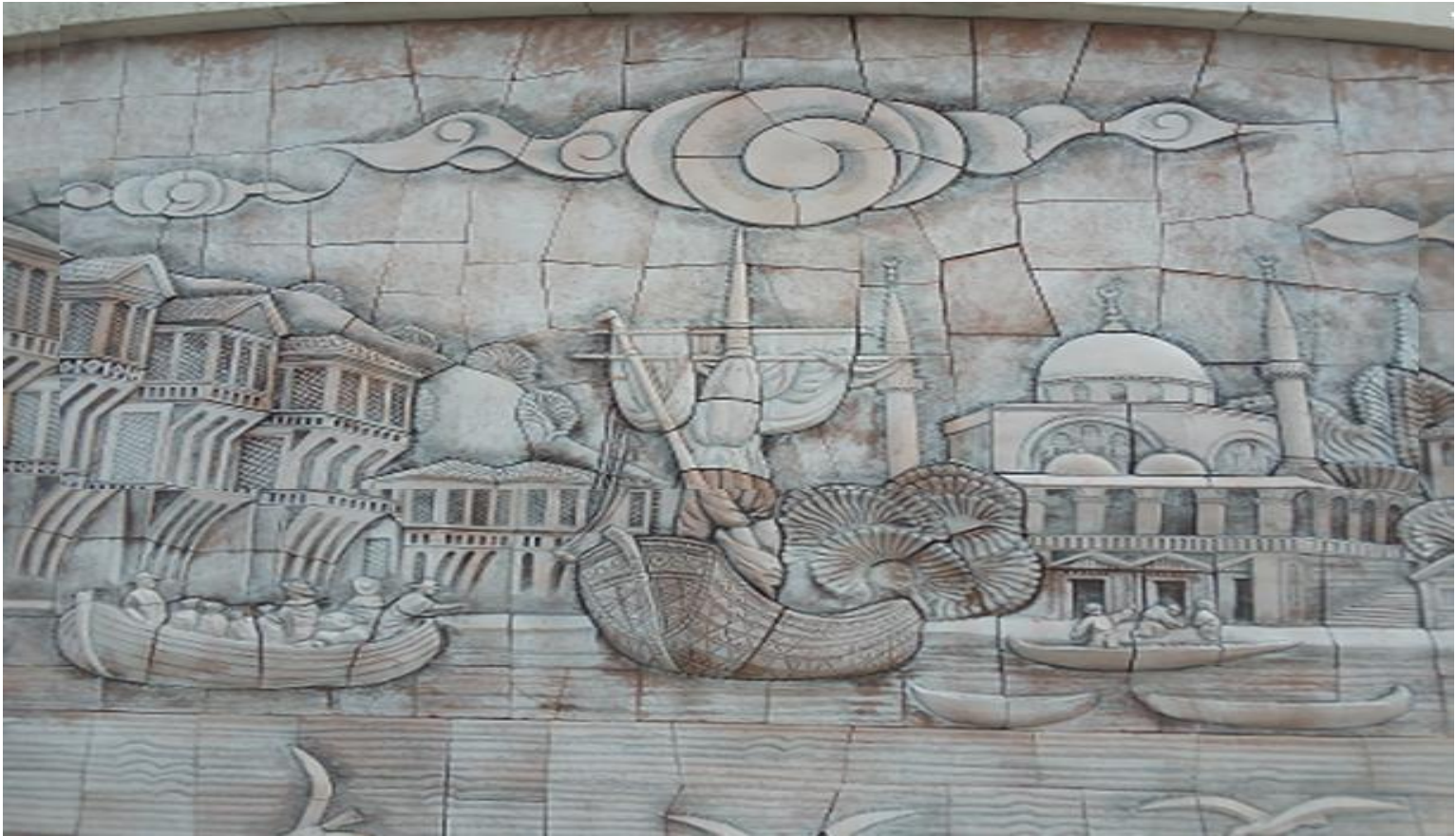
Szene Nr. 13: Fragment aus einem Istanbuler Viertel