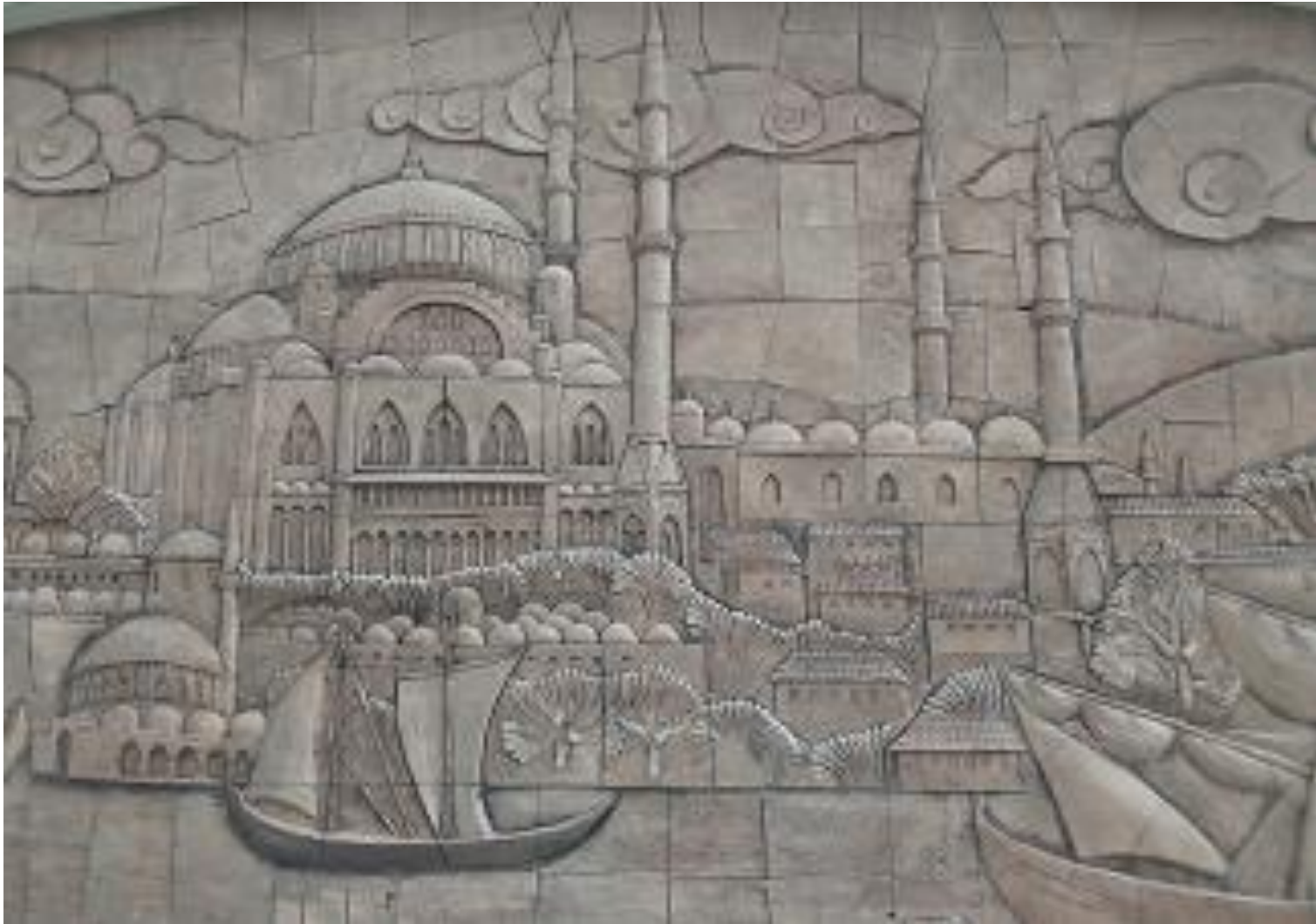
Szene Nr. 10: Blaue Moschee oder Sultanahmet-Moschee