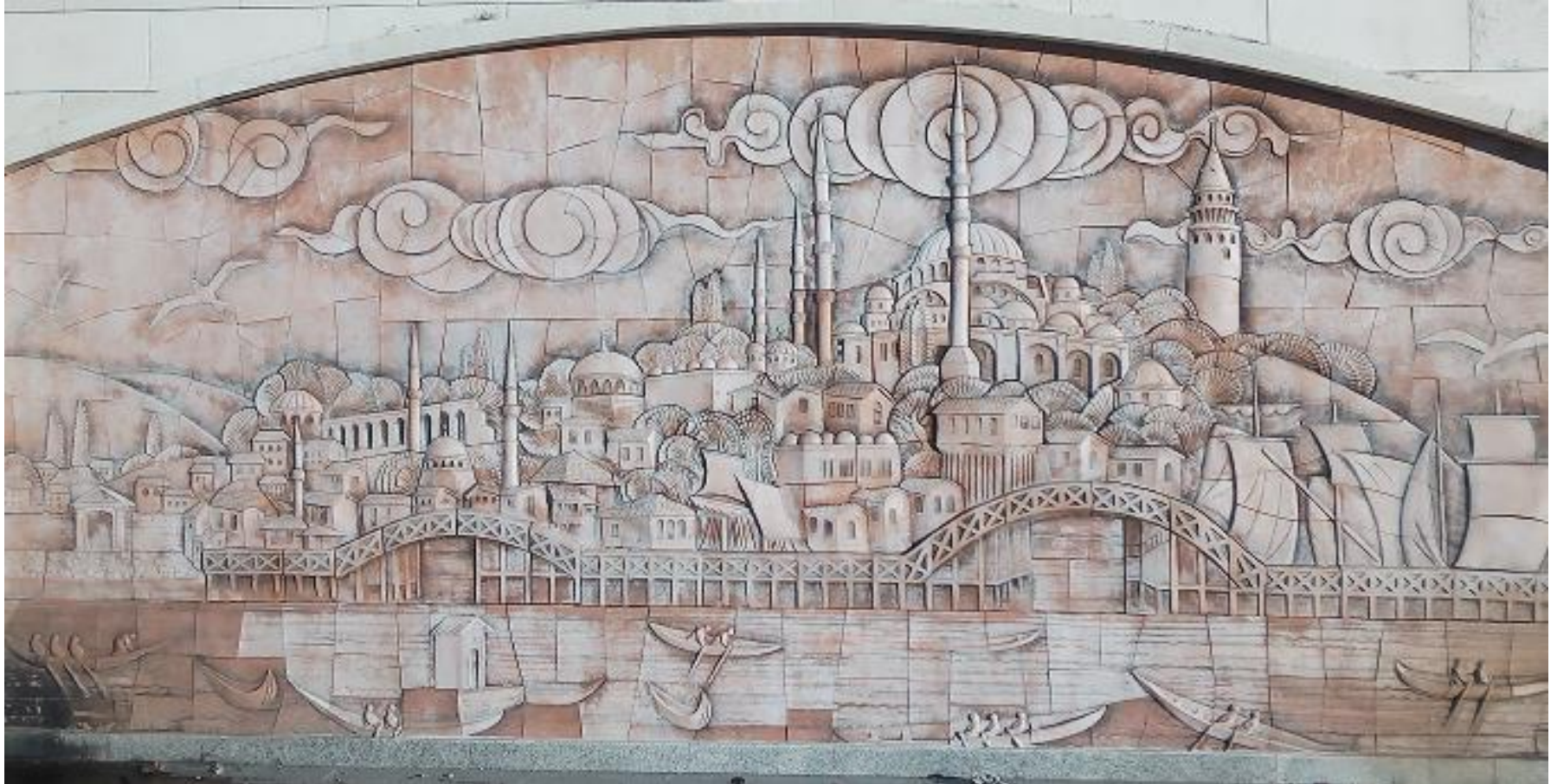
Szene Nr. 7: Blaue Moschee oder Sultanahmet-Moschee