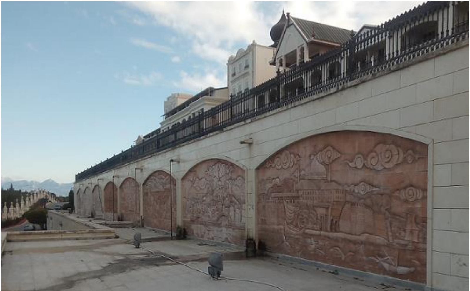
Wandbilder auf der linken Seite der Galerie