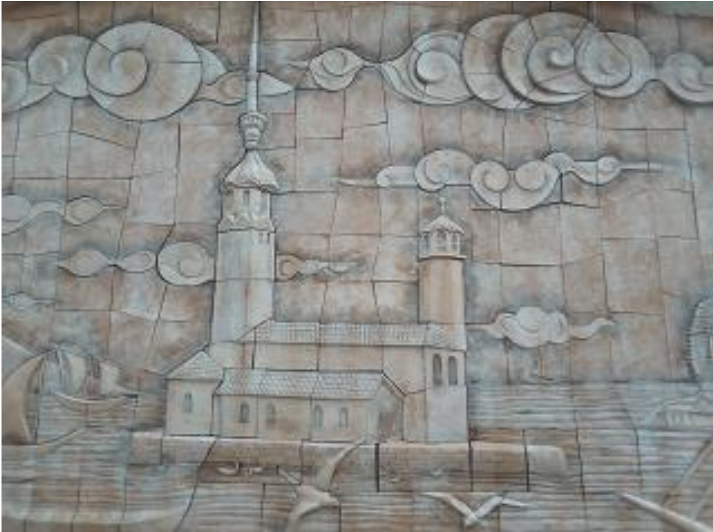
Szene Nr. 9: Mädchenturm