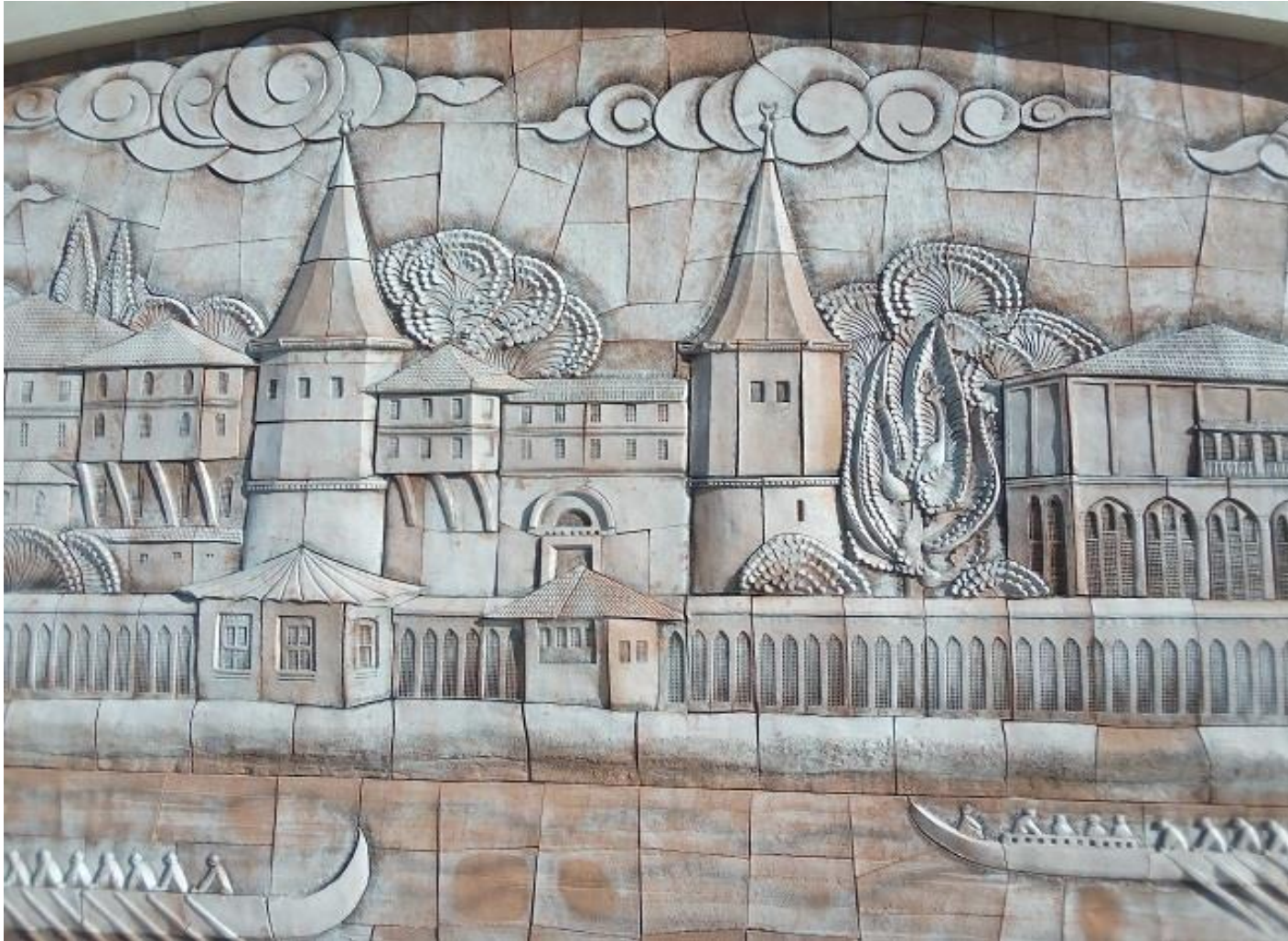
Szene Nr. 3: Fragment aus einem Istanbuler Viertel