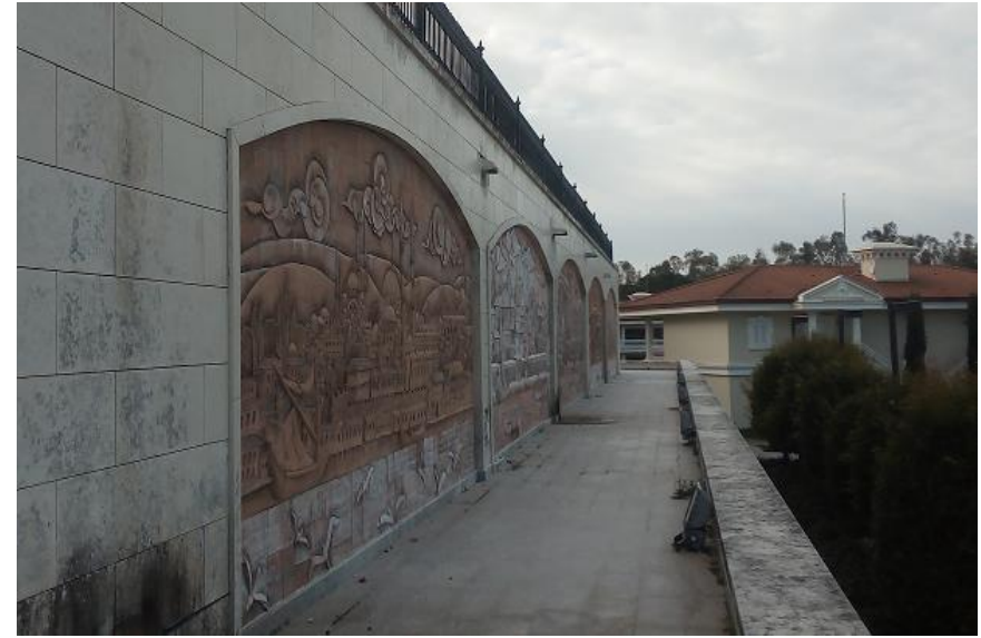
Die rechte Seite der Galerie umfasst fünf Bilder