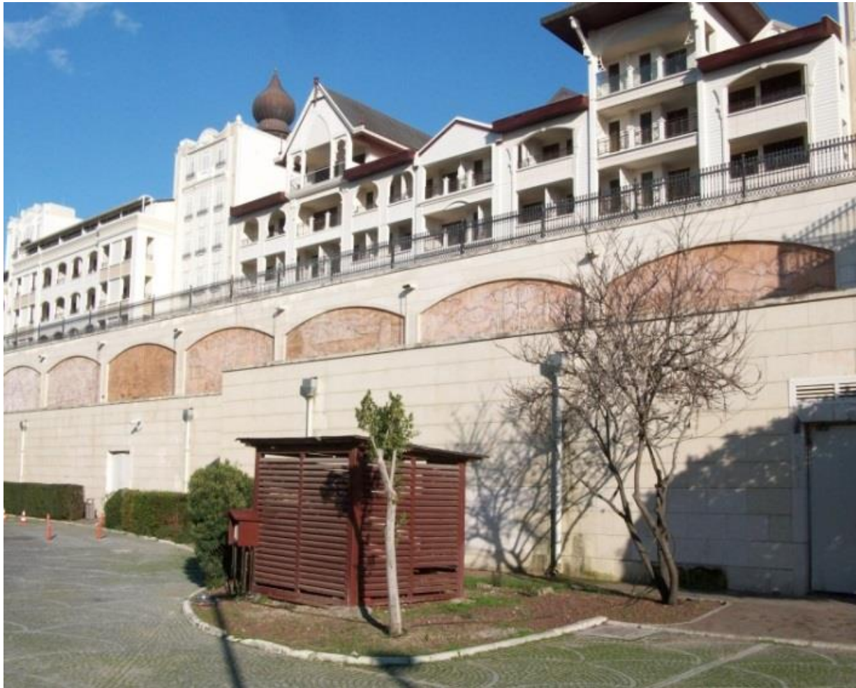
Die Wandgalerie mit Istanbuler Stadtszenen an der Außenwand des Europäischen Flügels des Titanic Mardan Palace Hotels