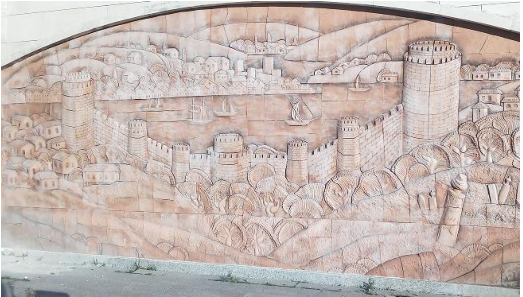
Szene Nr. 8: Istanbuler Stadtmauer (Mauer von Konstantinopel)