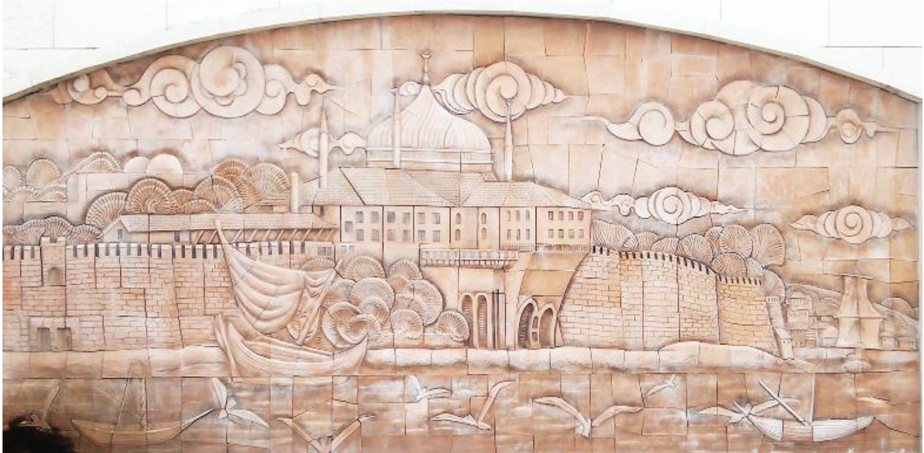
Szene Nr. 6: Hagia Sophia Moschee