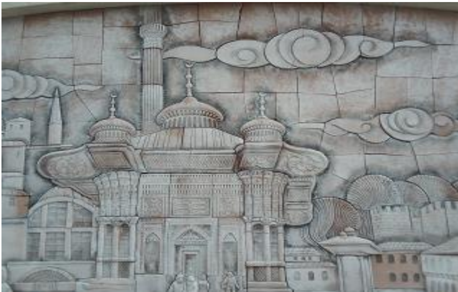
Szene Nr. 12: Fragment aus einem Istanbuler Viertel