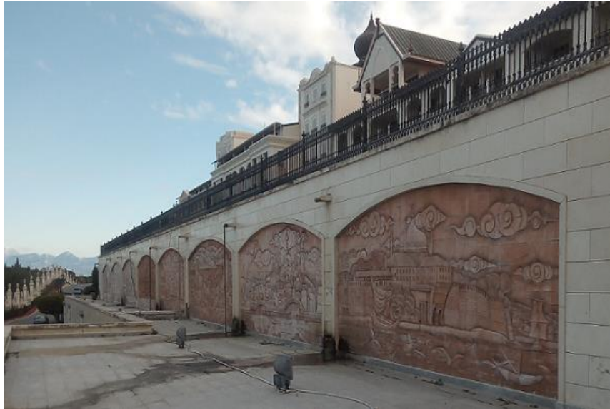
Die linke Seite der Galerie umfasst acht Bilder