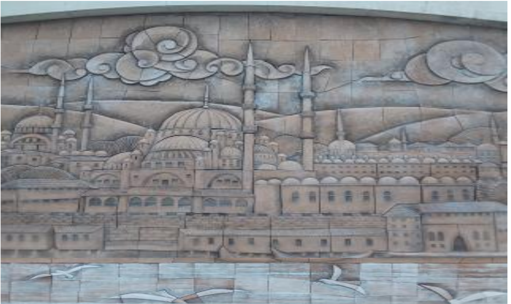
Szene Nr. 5: Hagia Sophia-Moschee