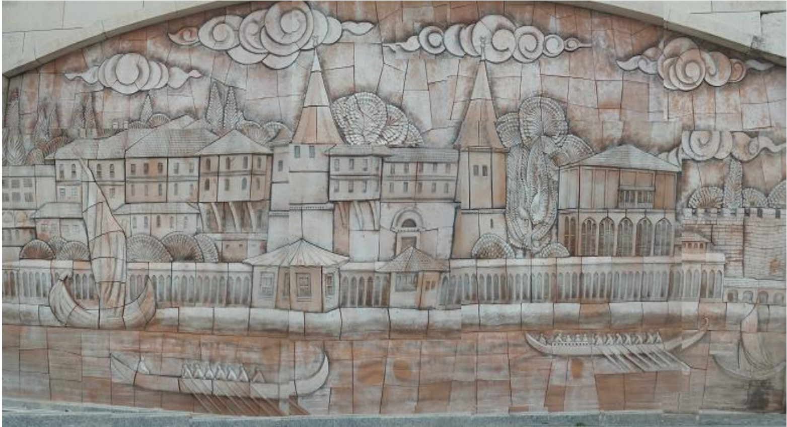
Szene Nr. 11: Fragment aus einem Istanbuler Viertel