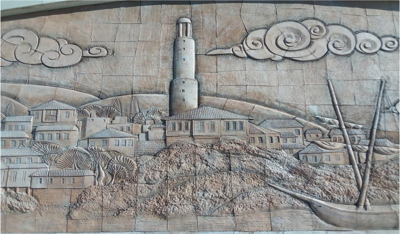
Szene Nr. 1: Leuchtturm „Ahir kap“