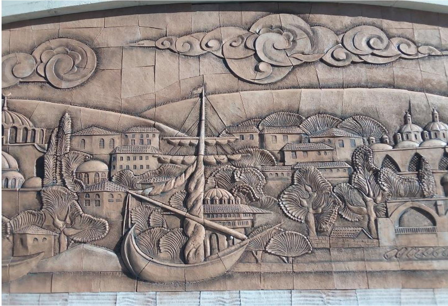
Szene Nr. 2: Fragment aus einem Istanbuler Viertel